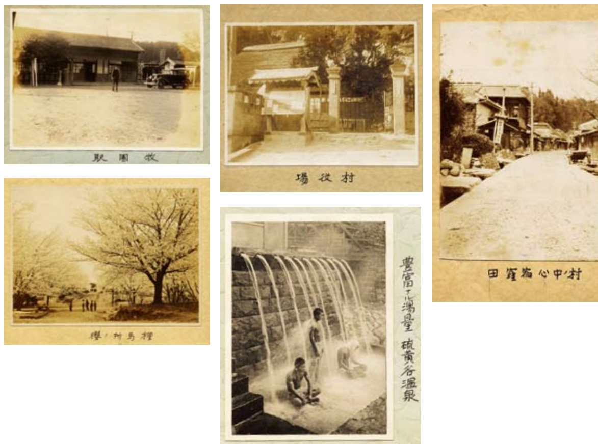
写真1 牧園村(霧島市牧園町)調査報告掲載の写真

これらの温泉や国立公園に指定された霧島への客が多いため、始良郡全体で55台ある乗用自動車のうち、約3分の1を占める19台を村内に有していることも記されている。