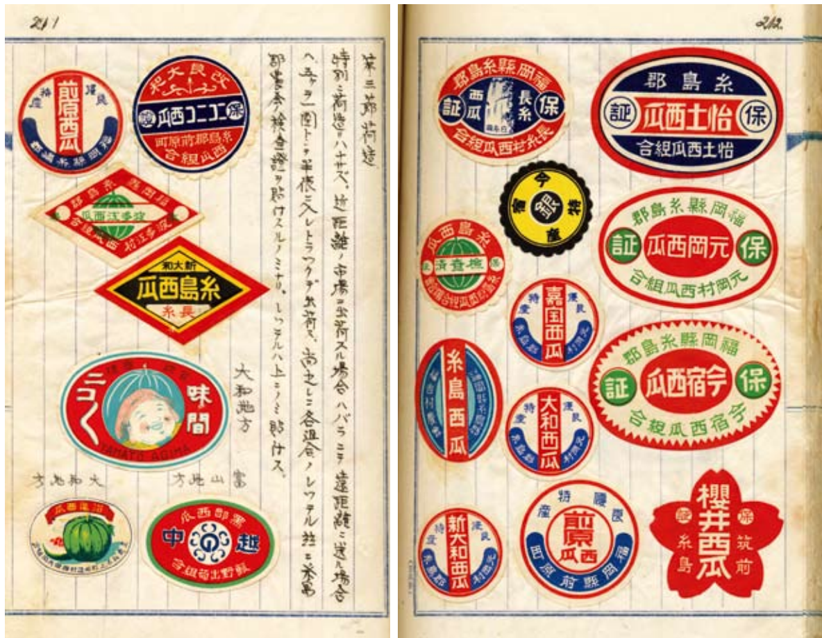
写真4 レッテル及び検査證

ちなみに本文中のデータによると、昭和9年(1934)の福岡市公設市場に於ける西瓜一斤の価格は、1/9:12銭、6/29:5銭、8銭、7/23:8銭、3銭、8/28:2.5銭、2.7銭、11/7:12銭などとなっている。