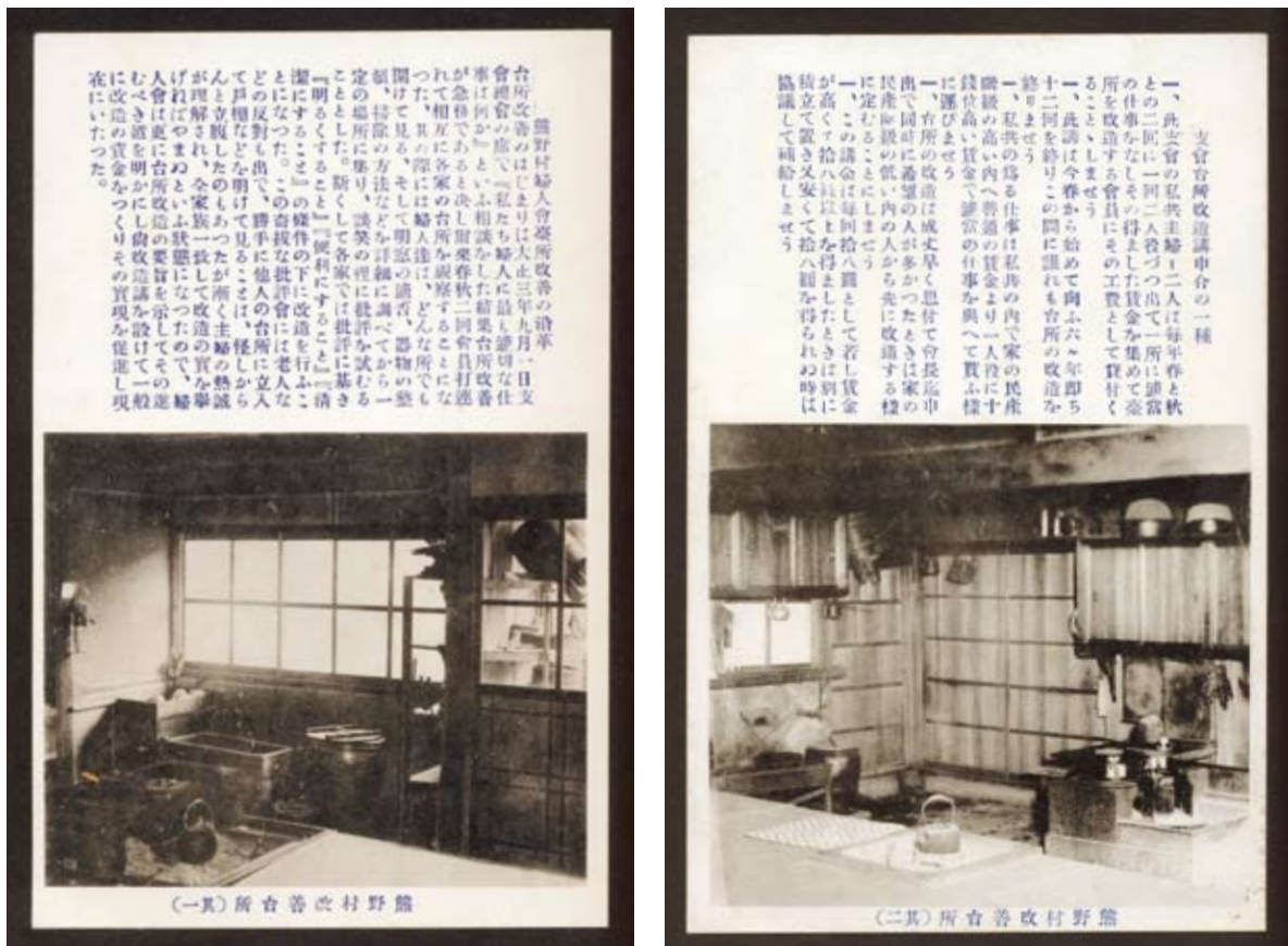
写真2 熊野村改善台所

この台所改善に努めた結果、台所の採光、下水の排除、器物の整理等が特に改善されたこと、大正9(1920)年には大阪朝日新聞に紹介されたこと、昭和2(1927)年6月には生活改善同盟会長より表彰されたことなどが記されている。