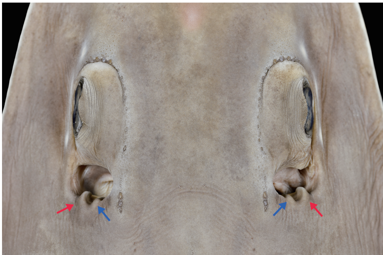
Fig. 2. Dorsal view of around the eyes of specimen (KAUM-I. 155944, male, 1041 mm TL) of Rhynchobatus australiae . Red and blue arrows indicate outer and inner spiracular folds.

胸鰭長 22.8；胸鰭前縁長 17.1；胸鰭後縁長 15.0；胸鰭基底長 19.0；胸鰭内縁長 3.8；胸鰭高 11.6；腹鰭長 12.8；腹鰭前縁長 7.5；腹鰭後縁長 8.1；腹鰭基底長 4.9；腹鰭内縁長 7.9；腹鰭高 5.3；尾鰭上葉長 15.5；尾鰭下葉長 11.6；背鰭間隔 17.5；腹鰭間隔 13.2；第 2 背鰭と尾鰭の間隔 11.3；胸鰭と腹鰭の間隔 7.2；腹鰭と尾鰭の間隔 37.3；腹鰭と第 1 背鰭の間隔 1.4；交接器内長 5.5；交接器外長 11.3.