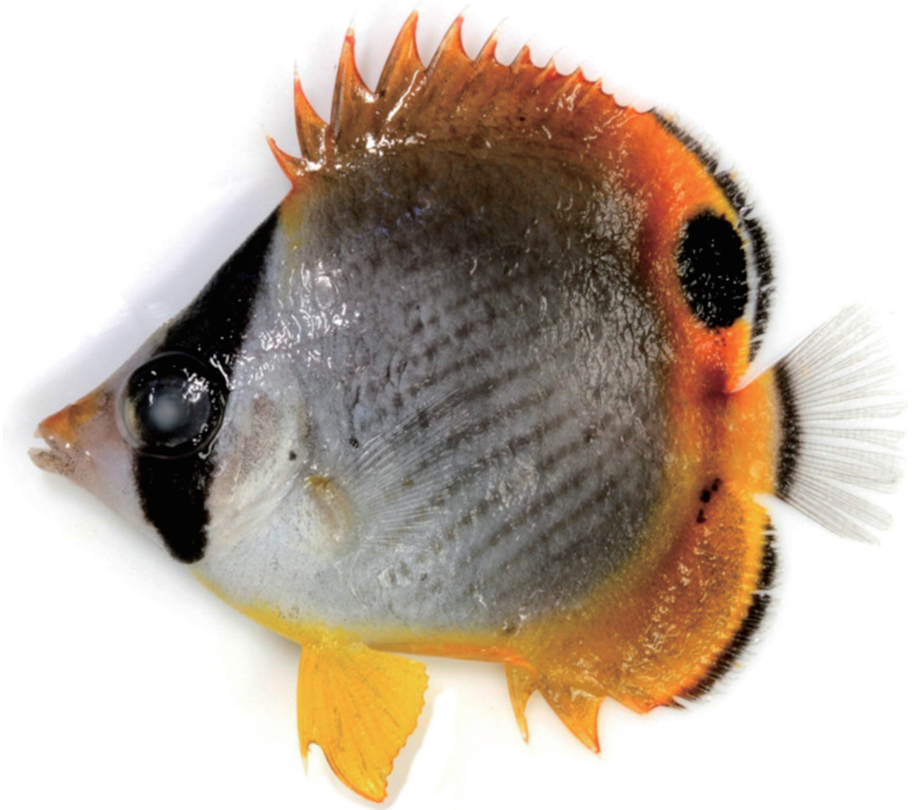
Fig. 2. Fresh specimen of Chaetodon adiergastos , FFNU P-02117, 31.7 mm standard length, rocky reef at Teguma-machi, Nagasaki City, Nagasaki Prefecture, Japan.

Motomura et al., 2021). 日本では、神奈川県（相模湾）、静岡県（相模灘）、和歌山県串本、兵庫県姫路、大分県蒲江から宮崎県延岡、宮崎県日向灘、琉球列島（沖縄島、瀬底島、伊江島、石垣島、竹富島）、長崎県長崎市などから記録がある（御前, 1986；栃本, 1996; Cadoret et al., 1999；島田, 2013; Iwatsuki et al., 2017; 神奈川県立生命の星・地球博物館, 2020；本研究）。