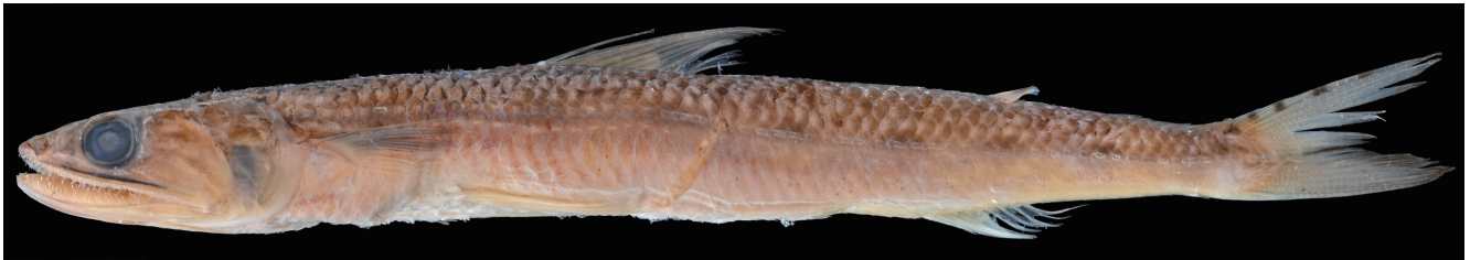
Fig. 2. Preserved specimen of Saurida undosquamis (KAUM-I. 142469, 148.3 mm SL) from Meitsu, Nichinan, Miyazaki Prefecture, Japan.