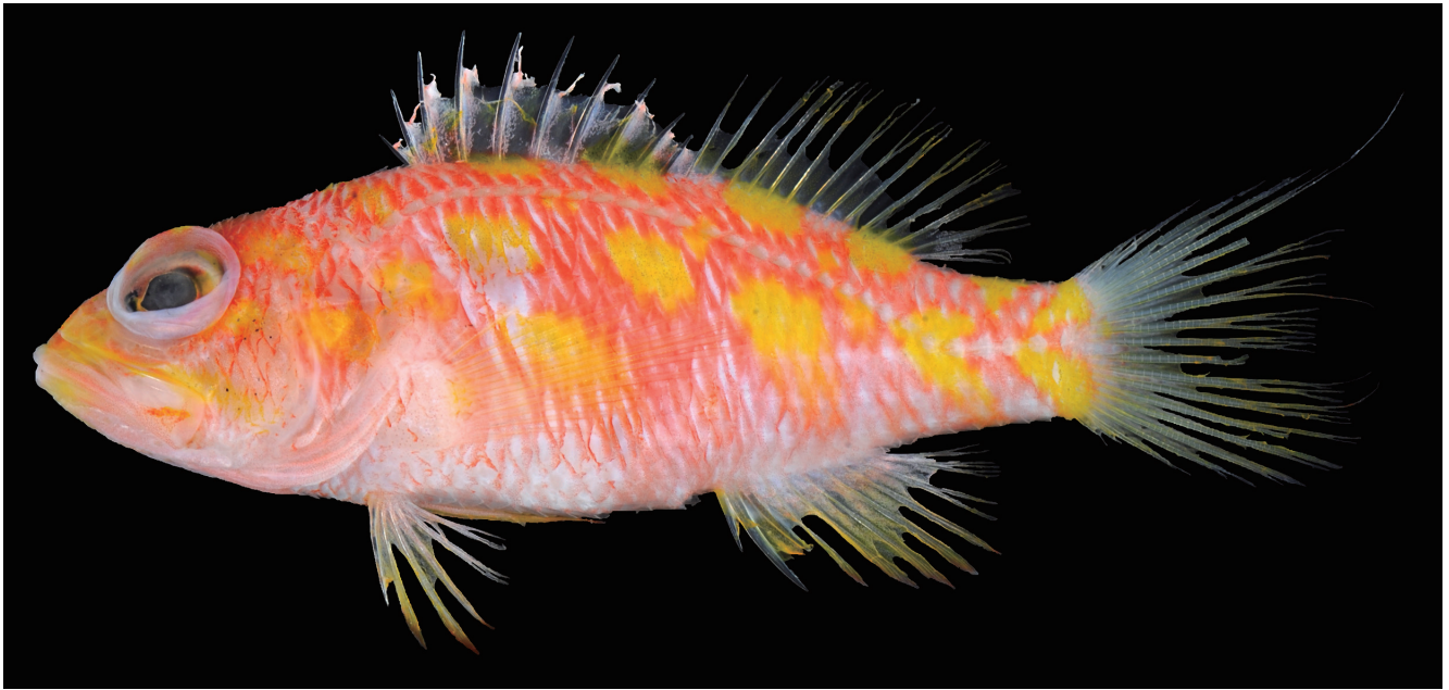
Fig. 2. Fresh specimen of Plectranthias xanthomaculatus (BSKU 136073, 47.3 mm SL) from the Enshu-nada Sea off the south coast of Omaezaki, Shizuoka Prefecture, Japan.