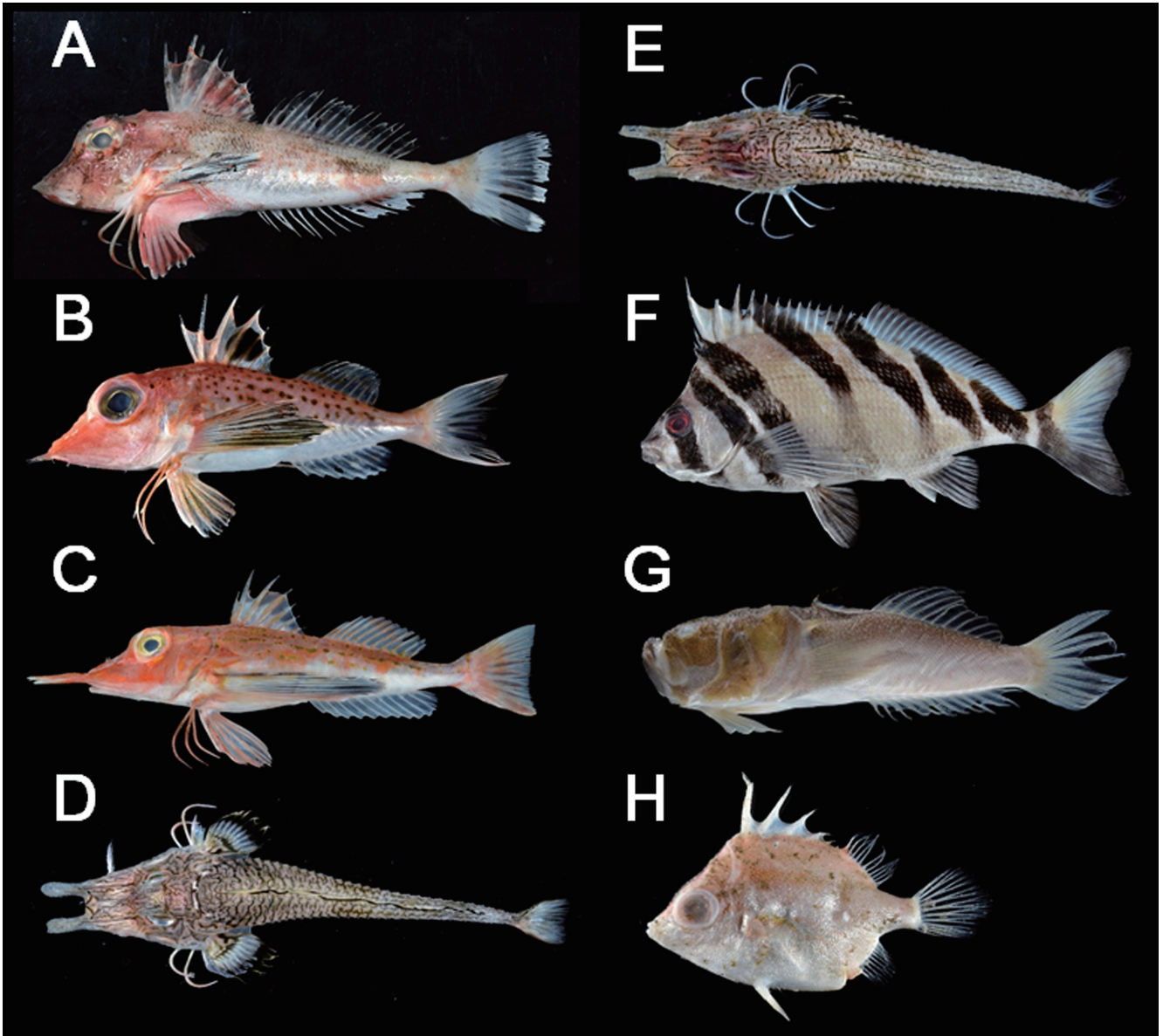
Fig. 3. Newly recorded fishes from off Miyagi Prefecture, Japan. A: KPM-NI 63085, Lepidotrigla kishinouyei ; B: KPM-NI 63087, Pterygotrigla hemistica ; C: KPM-NI 63459, Pterygotrigla multiocellata ; D: KPM-NI 65961, Peristedion liorhynchus ; E: KPM-NI 65962, Peristedion orientale ; F: KPM-NI 58126, Goniistius quadricornis ; G: KPM-NI 65950, Uranoscopus tosaе ; H: KPM-NI 65955, Triacanthodes anomalus .

ないこと、胸鰭上方の上膊棘が長いことから、山田・柳下 (2013a) と Richards and Yato (2014) にしたがいがオニソコホウボウに同定された。