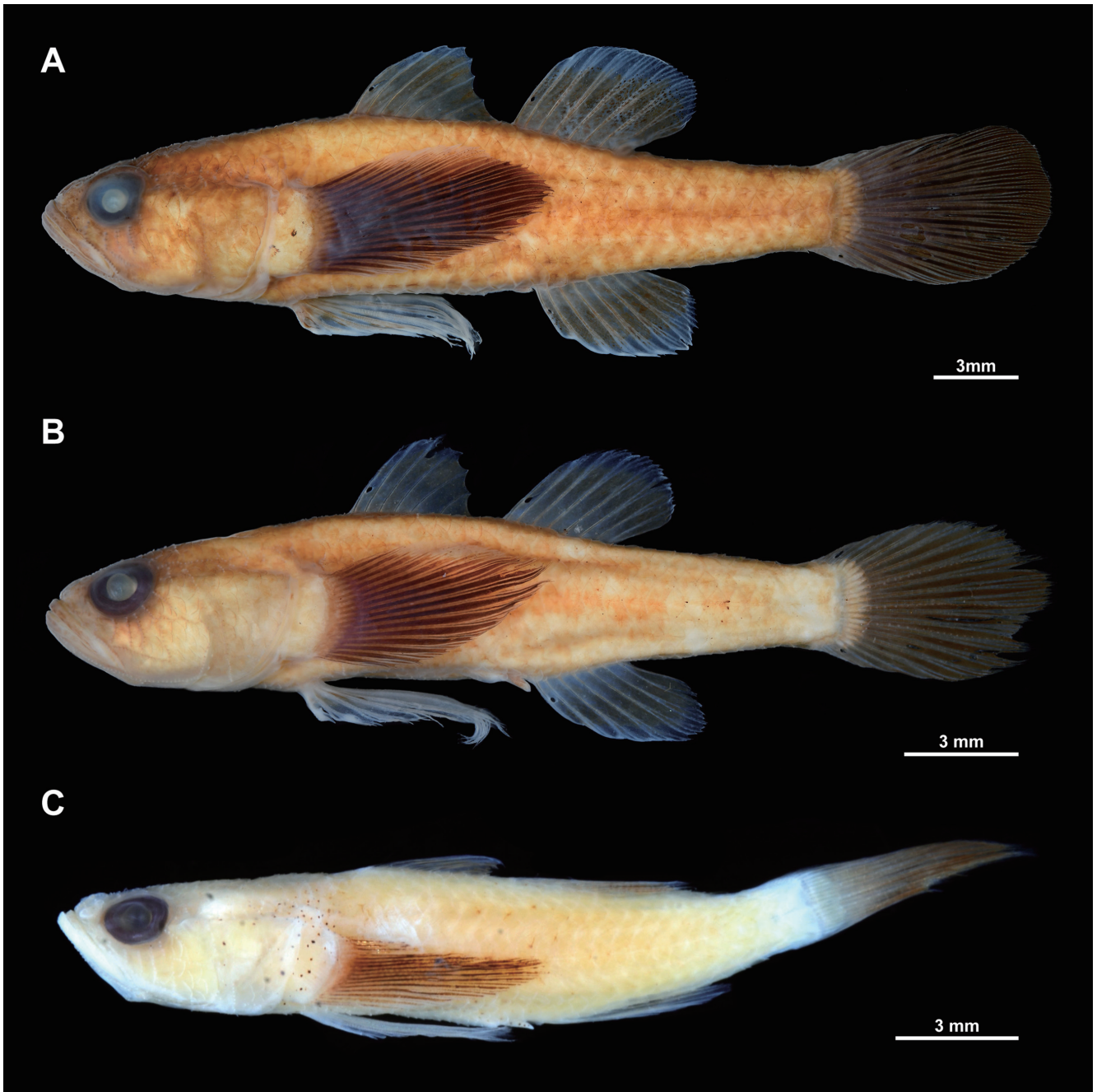
Fig. 3. Lateral views of preserved specimens of Egglestonichthys rubidus from Iriomote Island, Yaeyama Islands, Ryukyu Archipelago, Japan (A: BLIP 20070301, male, 27.9 mm SL; B: BLIP 20070300, male, 20.6 mm SL; C: ZUMT 65566, male, 18.2 mm SL).