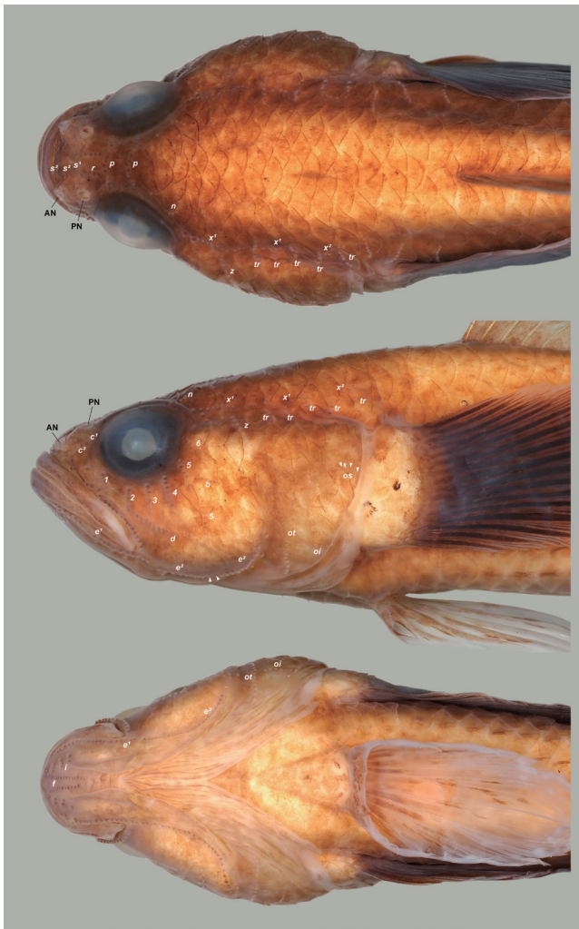
Fig. 5. Dorsal (top), lateral (middle) and ventral (bottom) views of head of preserved specimen of Egglestonichthys rubidus (BLIP 20070301, male, 27.9 mm SL), showing cephalic sensory system. AN and PN indicate anterior and posterior nostrils, respectively. Arrow heads indicate damaged sensory papillae in relatively poor condition.

いことから、本研究で記載した1標本 (BLIP 20070301) に基づき、新標準和名コクトウハゼを提唱する。本和名は、生時に体と各鱗が一様に褐色である本種の色彩的特徴が琉球列島特産の黒砂糖を連想させることに因む。