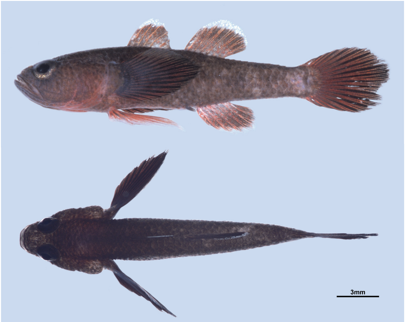
Fig. 2. Lateral (top) and dorsal (bottom) views of Egglestonichthys rubidus from Iriomote Island, Yaeyama Islands, Ryukyu Archipelago, Japan (BLIP 20070300, male, 20.6 mm SL, immediately after fixation).

Fujiwara et al., 2021: 74, fig. 1 (Iriomote Island, Yaeyama Islands, Ryukyu Archipelago, Japan).