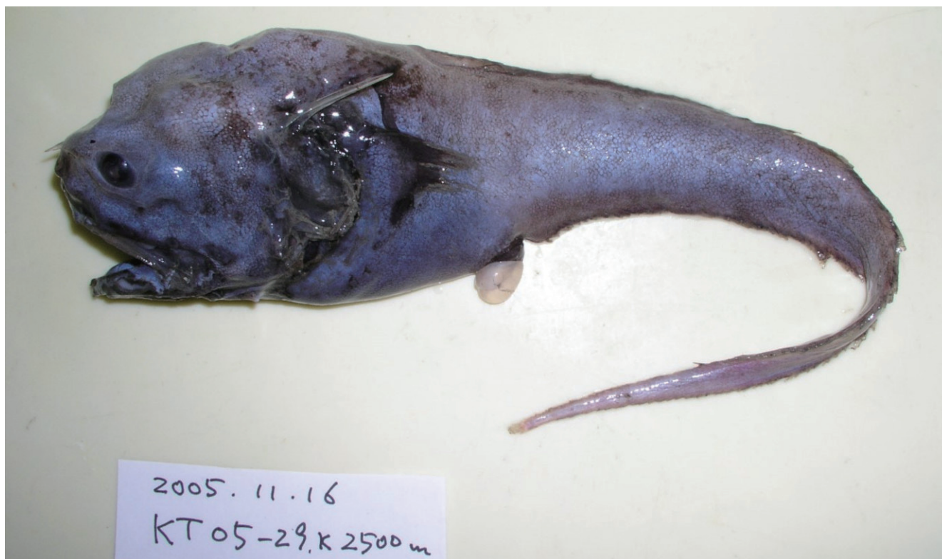
Fig. 1. Fresh specimen of Acanthonus armatus (BSKU 115842, 345.8 mm SL) collected off Tosa Bay, photographed by H. Endo.

たが、日本産標本の特徴は十分に判明していない。そのため、本研究では日本産ハナトゲアシロの成魚 11 標本に基づいて形態を記載し、日本における追加記録を報告する。