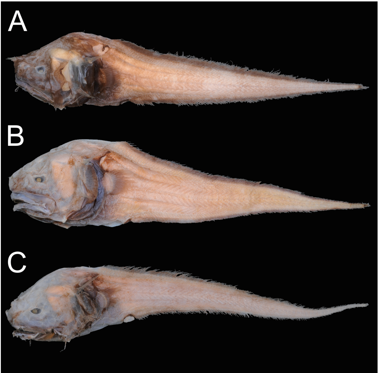
Fig. 2. Preserved specimens of Acanthonus armatus from Japan. A: BSKU 86838, 194.8 mm SL, Kumano-nada Sea; B: BSKU 112948, 346.9 mm SL, off Tori-shima island; C: BSKU 115842, 345.8 mm SL, off Tosa Bay.

et al., 2008: 48, fig. 3C (brief description, key to species; Brazil); Fricke et al., 2009: 27 (listed; Réunion Island); Fricke et al., 2011: 366 (listed; New Caledonia); Nakabo and Kai, 2013: 514, unnumbered fig. (key to species); Hanke et al., 2015: 73, fig. 4 (brief description; British Columbia); Lins Oliveira et al., 2015: 107, unnumbered fig. (brief description; Brazil); Nielsen, 2016: 1950 (listed); Vieira et al., 2016: 967, fig. 3d (listed; off Cape Verde); Carneiro et al., 2019: 156 (listed; Azores); Polanco et al., 2019: 769, fig. 1 (underwater photograph; Caribbean Sea); Koeda et al., 2021: 5, fig. 5A (listed; Shotoku Seamounts); Love et al., 2021: 81 (listed); Fermon et al., 2022: 206 (listed; Gabon); Fricke et al., 2024: 257 (listed; Mexico); Girard et al., 2024: 22, fig. 1B (description of larva, osteology; Florida); Wong and Chen, 2024: 10 (phylogenetic relationships).